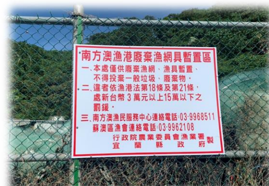
蘇澳區漁港-廢漁網暫存區