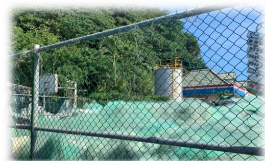
廢漁網回收暫存現況- 混雜未分類不好回收

環保署 農業廢棄物宣導網站 ，提供漁業廢棄物回收再利用業者名單及相關最新資訊： https://reurl.cc/q8bjmN